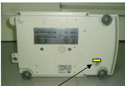
Slika 5. Izgled natpisne pločice