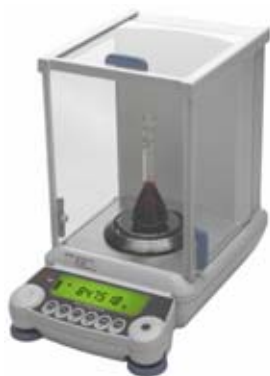
Slika 1. Izgled vage HP s okruglim prijamnikom tereta i zaštitom od strujanja zraka