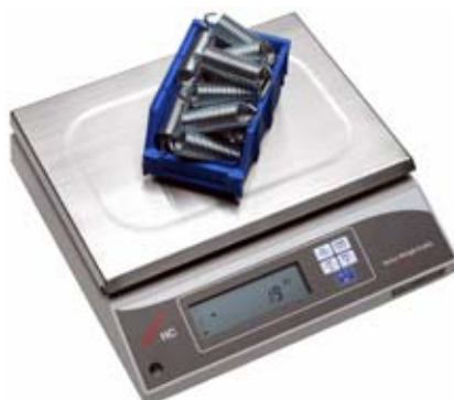
Slika 3. Izgled vage HC