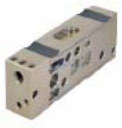
Slika 4. Izgled mjernog pretvornika