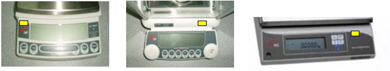
Slika 8. Godišnje žig u obliku naljepnice