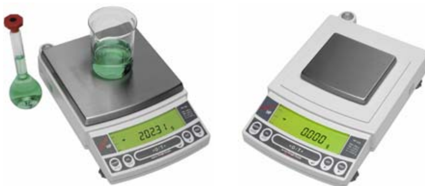
Slika 2 . Izgled vage HP s pravokutnim prijamnikom opterećenja